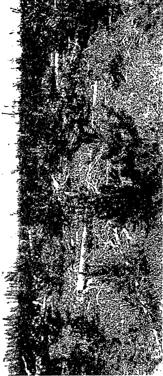
Figure 1. Vue d'ensemble de la plantation lors de l'établissement du dispositif expérimental