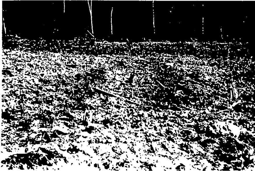
Figure 2. Préparation du terrain avant la plantation.