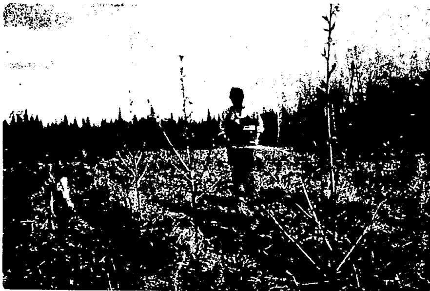
Figure 3. Fertilisation du dispositif en juin 1974.